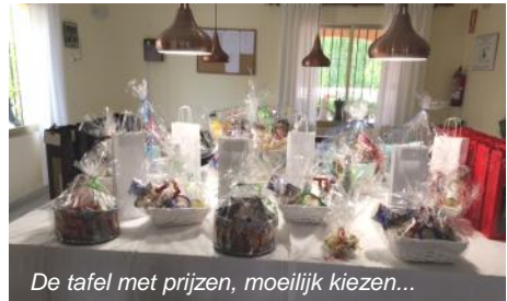
De tafel met prijzen, moeilijk kiezen...

Genieten van klassieke muziek? Ook aan de Costa Blanca?